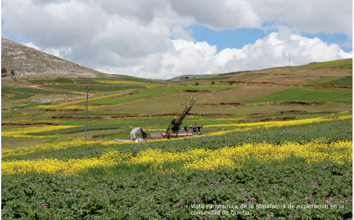
Vista Panorámica de la plataforma de exploración en la comunidad de Quicha.

Hasta el mes de marzo, Mantaro Perú ha implementado diez de las doce plataformas de perforación previstas en su programa de exploración en la localidad de Quicha Grande. La empresa tiene previsto culminar el referido programa durante el 2011 y los resultados de los estudios en marcha permitirán determinar la cantidad y calidad de los recursos que existen en la zona.