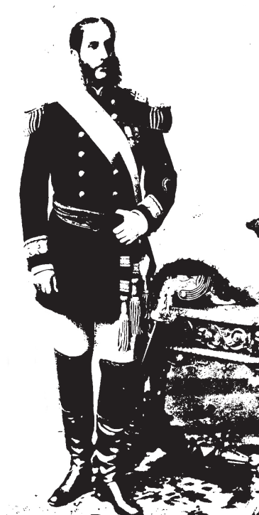
Andrés Avelino Cáceres, jefe del ejército del centro del Perú en la Guerra del Pacífico.

En Concepción, un destacamento chileno que no quiso rendirse fue exterminado por campesinos enfurecidos a consecuencia de recientes agravios. En conjunto, fue el mejor momento del pequeño Ejército del Centro, así como de las fuerzas auxiliares indígenas de Junín, que se dirigían en quechua al taita Andrés A. Cáceres