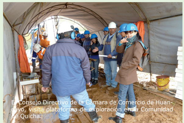
El Consejo Directivo de la Cámara de Comercio de Huancayo, visita plataforma de exploración en la Comunidad de Quicha.

Asimismo, los visitantes se trasladaron a la cima de los cerros donde aflora el manto de fosfato, en los cuales pudieron observar que estas zonas se encuentran a una considerable distancia de las comunidades y las áreas cultivables.