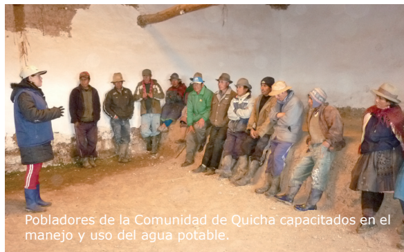
Pobladores de la Comunidad de Quicha capacitados en el manejo y uso del agua potable.

Este proceso de sensibilización y educación conduce a un desarrollo de capacidades y conciencia de la población, de manera tal que el acceso a los servicios de agua potable no se