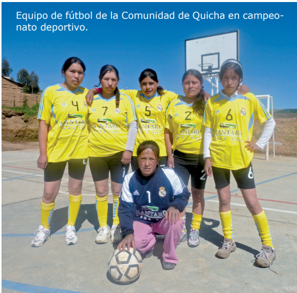
Equipo de fútbol de la Comunidad de Quicha en campeonato deportivo.

Como se recordará, Mantaro Perú y los pobladores de la Comunidad Campesina de Quicha Grande concluyeron la construcción de la losa multideportiva comunal el 28 de febrero de 2011. El proyecto se realizó en el marco de las políticas de responsabilidad social y los lineamientos para la generación del empleo local. En total, 40 Comuneros de Quicha Grande accedieron a puestos de trabajo temporales durante la construcción de la losa multideportiva comunal.