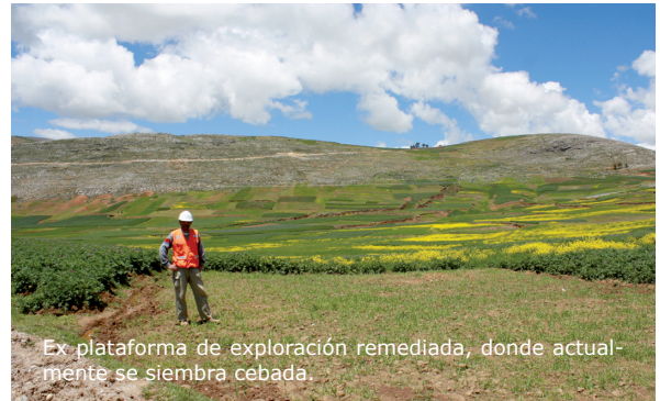
Ex plataforma de exploración remediada, donde actualmente se siembra cebada.

La Declaración de Impacto Ambiental (DIA), aprobada a través de Constancia de Aprobación Automática N° 089-2010-MEM-AAM emitida por el Ministerio de Energía y Minas (MEM), fue presentada por la empresa el 14 de diciembre. Previamente, Mantaro Perú obtuvo el permiso de la Comunidad Campesina de Quicha Grande y suscribió acuerdos con los propietarios de los terrenos en los que Mantaro Perú instalaría las plataformas de perforación.