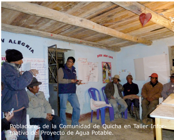
Pobladores de la Comunidad de Quicha en Taller Informativo del Proyecto de Agua Potable.

Mantaro Perú participó el 8 de febrero en una reunión en la Comunidad Campesina de Quicha Grande, donde representantes de la ONG Agua Limpia propusieron el desarrollo de un proyecto de agua potable para la comunidad, que incluiría la instalación de nueva infraestructura para la captación de agua, la cual sería conectada a través 850 metros de tubería con la red existente de agua potable.