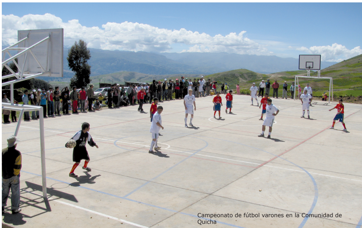
Campeonato de fútbol varones en la Comunidad de Quicha

Con un campeonato de vóley y fulbito, organizado por Mantaro Perú y la comunidad los días martes 1° y miércoles 2 de marzo, se inauguró la nueva losa multideportiva comunal, implementada en la comunidad campesina de Quicha Grande mediante una inversión de 66 mil nuevos soles realizada por la empresa.