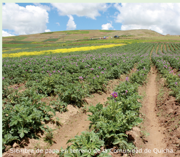
Siembra de papa en terreno de la Comunidad de Quicha.

La implementación del proyecto se realiza con la participación activa de los beneficiarios (20 comuneros con 2 hectáreas de siembra). Las familias aportarán sus terrenos listos para la siembra, la mano de obra y la yunta. Asimismo, contribuyen con el manejo agronómico del cultivo hasta la cosecha, lo que incluye las actividades de deshierbo, aporque, fertilización de fondo y de cobertura.