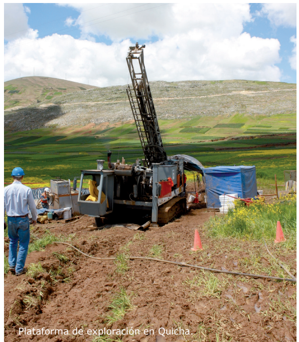
Plataforma de exploración en Quicha.

Cabe precisar que el 22 de diciembre de 2010 el Ministerio de Energía y Minas aprobó la Declaración de Impacto Ambiental (DIA) presentada por Mantaro Perú para desarrollar su Programa de Exploración en Quicha Grande. De esta forma la