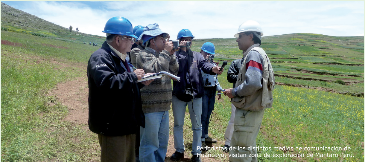
Periodistas de los distintos medios de comunicación de Huancayo, visitan zona de exploración de Mantaro Perú.

En el marco de su compromiso con la transparencia, Mantaro Perú invitó a visitar la zona donde se desarrolla el proyecto Fosfatos Mantaro a representantes y autoridades del Gobierno Regional, la provincia de Concepción, la Defensoría del Pueblo, la Embajada de Canadá, ONG's, periodistas, líderes de opinión de la Región Junín y comuneros de la margen derecha del Valle del Mantaro.